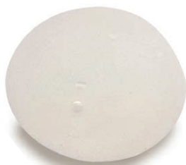
Exemple de prothèse.