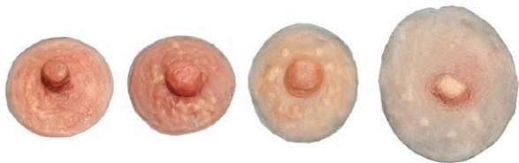
Mamelons artificiels (autocollants)

Certaines femmes choisissent aussi de porter un mamelon artificiel (« un autocollant ») ou de se faire tatouer un signe ou un dessin plutôt que de refaire le mamelon et l'aréole (3 e étape de la reconstruction).