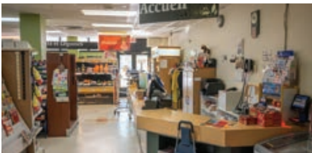
Épicerie dans l'immeuble