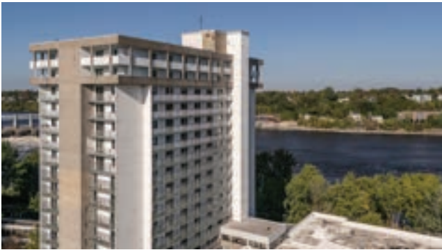
Centre d'hébergement de soins de longue durée (CHSLD) Angelica