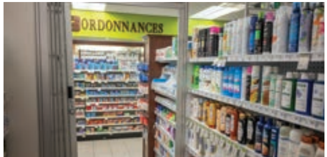
Pharmacie dans l'immeuble