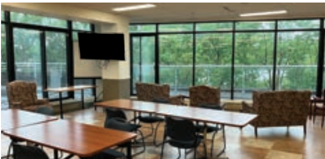
Salle d'activités et de rassemblement