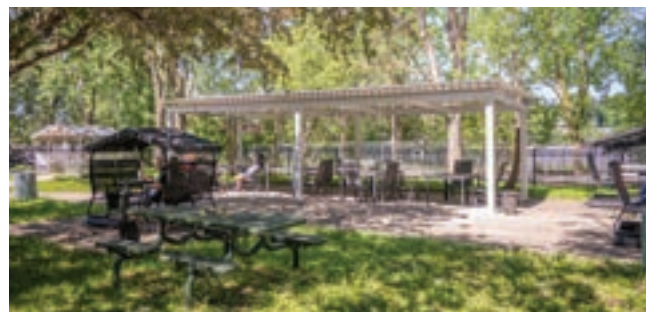
Pergola pour les activités extérieures