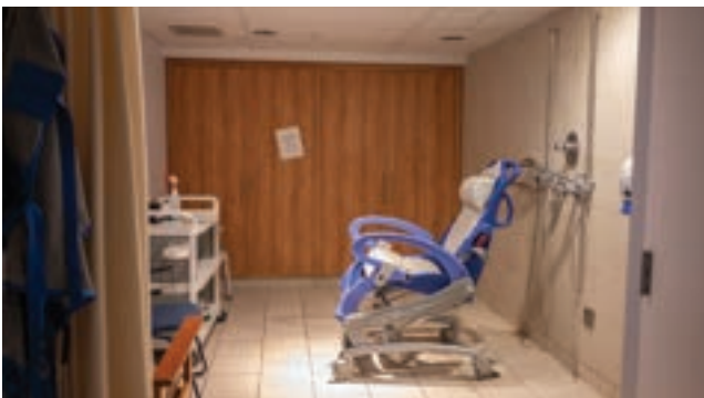
Salle de douches