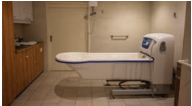
Salle de bains adaptée