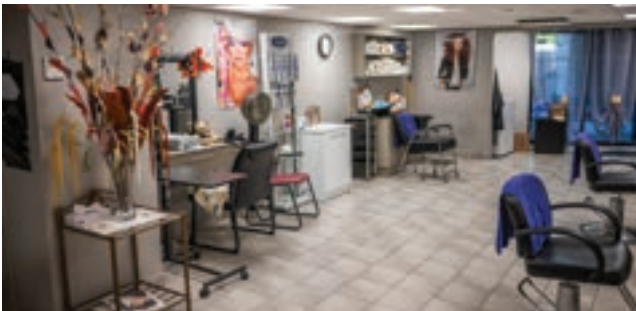
Salon de coiffure dans l'immeuble