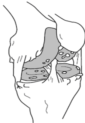
Articulation avec arthrose